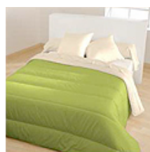
Fougère / Lin