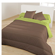
Chocolat / Fougère