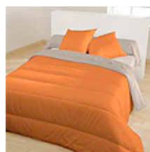
Terre Cuite / Taupe