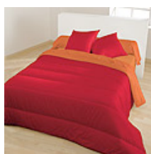
Carmin / Taupe