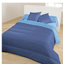
Indigo / Bleu lavande