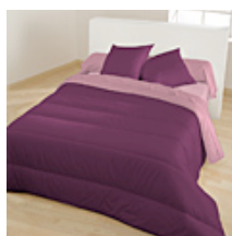
Raisin / Rose Glycine