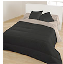
Noir / Taupe